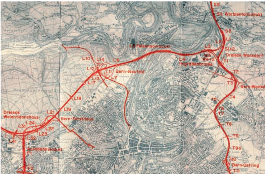
Bild 1 Die Stadtangente Bern.

Gewichtung: 0 Beleuchtung nicht notwendig, 1 Beleuchtung notwendig, Zwischenwerte sind möglich.