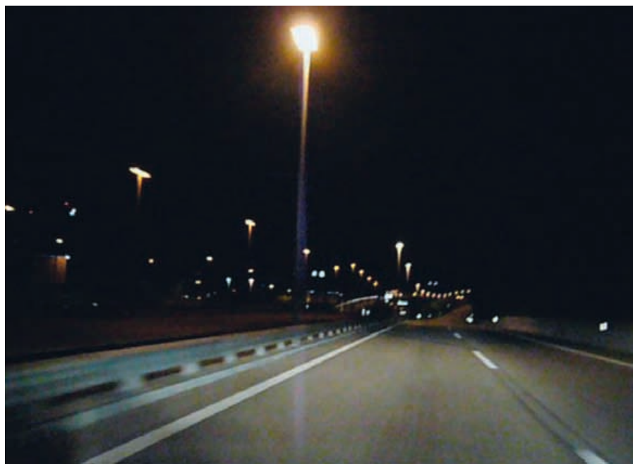
Teilstrecke Wankdorf (T1–T2) der Stadttangente Bern.

Vor 45 Jahren waren Begriffe wie Energieoptimierung, Lichtverschmutzung oder CO 2 -Ausstoss ungefähr so selten wie heutzutage gasbetriebene Laternen in der öffentlichen Beleuchtung. Bereits 12 Jahre nach die-